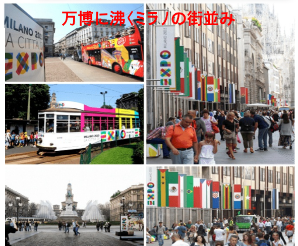
万博に沸くミラノの街並み