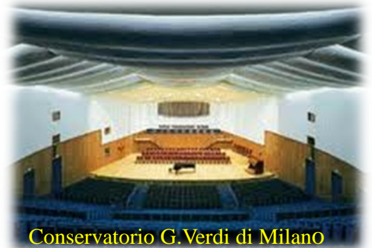
Conservatorio G. Verdi di Milano